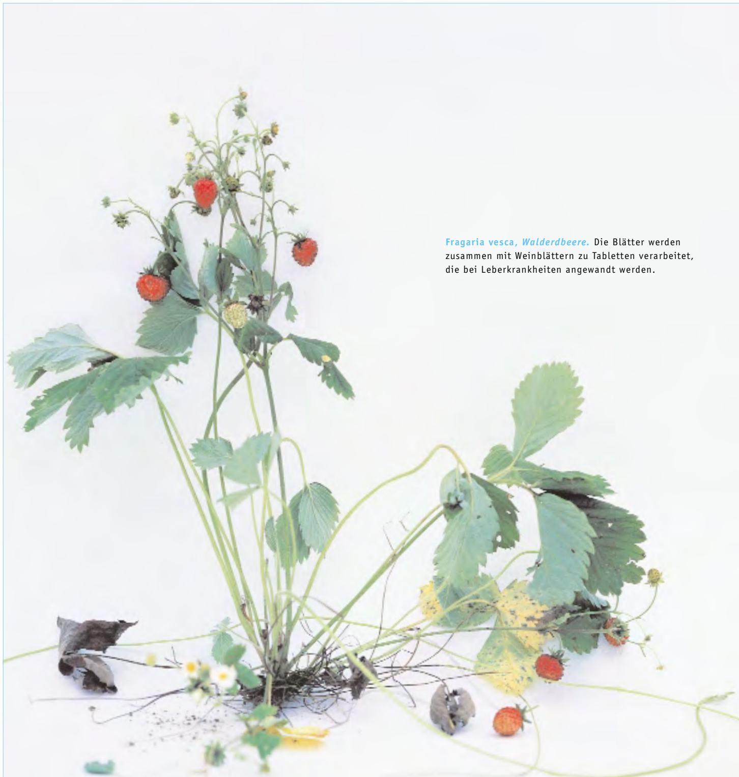
Fragaria vesca, Walderdbeere. Die Blätter werden zusammen mit Weinblättern zu Tabletten verarbeitet, die bei Leberkrankheiten angewandt werden.