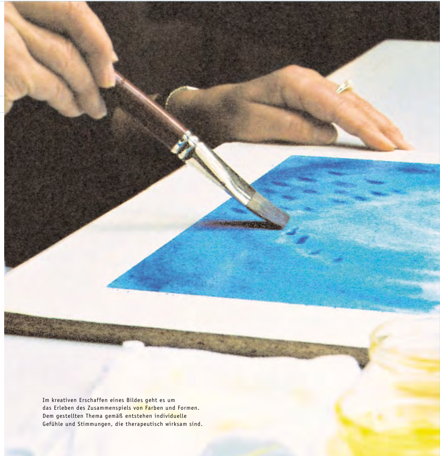
Im kreativen Erschaffen eines Bildes geht es um das Erleben des Zusammenspiels von Farben und Formen. Dem gestellten Thema gemäß entstehen individuelle Gefühle und Stimmungen, die therapeutisch wirksam sind.

Bereits 1921 entstanden in Arlesheim bei Basel (Schweiz) und in Stuttgart (Deutschland) erste, damals noch bescheidene klinische Einrichtungen, in denen der neue medizinische Ansatz praktisch zur Anwendung kam. Darauf aufbauend hat sich anthroposophische Medizin im Lauf der