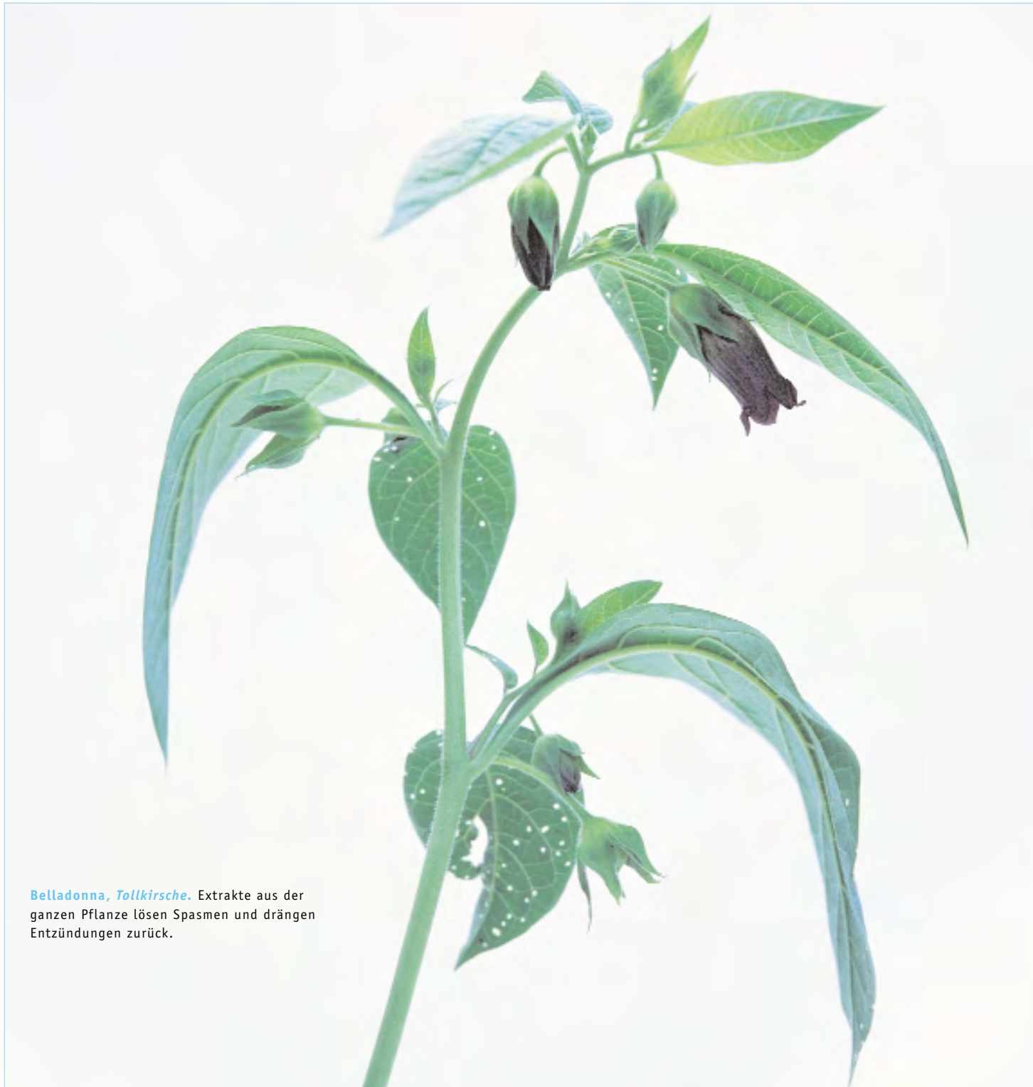
Belladonna, Tollkirsche. Extrakte aus der ganzen Pflanze lösen Spasmen und drängen Entzündungen zurück.