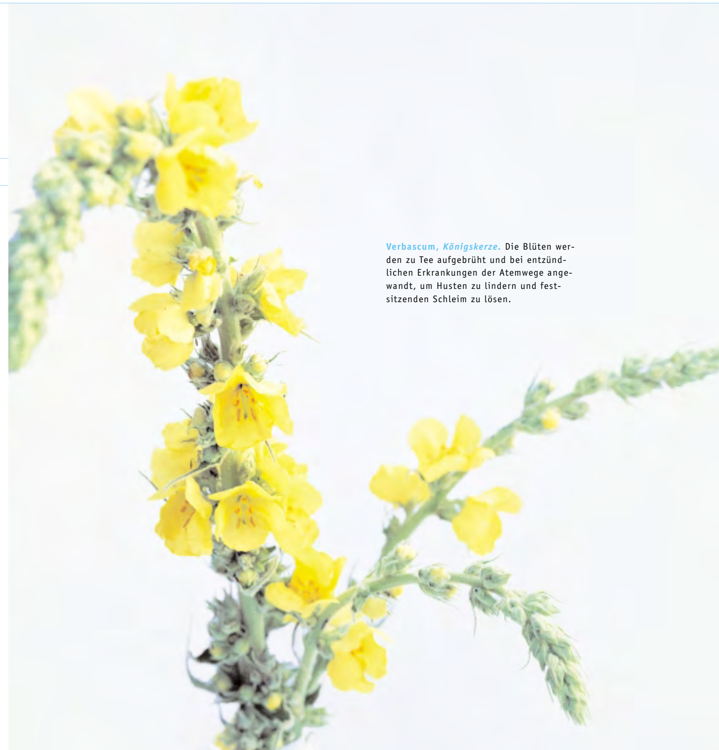
Verbascum, Königskerze. Die Blüten werden zu Tee aufgebrüht und bei entzündlichen Erkrankungen der Atemwege angewandt, um Husten zu lindern und fest-sitzenden Schleim zu lösen.

Mit einer Krankheit bekommt ein Mensch die Gelegenheit, die gestörte Gleichgewichtslage, in die er mit Körper und Seele geraten ist, zu erkennen, zu verstehen und mit Hilfe der Therapie wieder ins Lot zu bringen. Chronische Krankheiten können ihm die Möglichkeit bieten, neue Verhaltensweisen zu lernen und als Persönlichkeit reifer zu werden. Anthroposophische Ärzte unterstützen den Patienten gerade bei dieser Aufgabe. Sie stärken seine Eigenverantwortung, anerkennen seine Mündigkeit, fördern sein Recht auf Mitbestimmung bei der Wahl der Therapierichtung und bestärken ihn, sich selbst gesund zu erhalten.