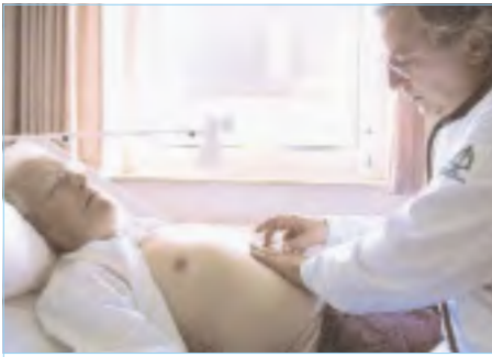
Die beim Abtasten des Bauches (links) erhobenen Tastbefunde werden mit einer Ultraschall-Untersuchung (rechts) überprüft und vervollständigt.