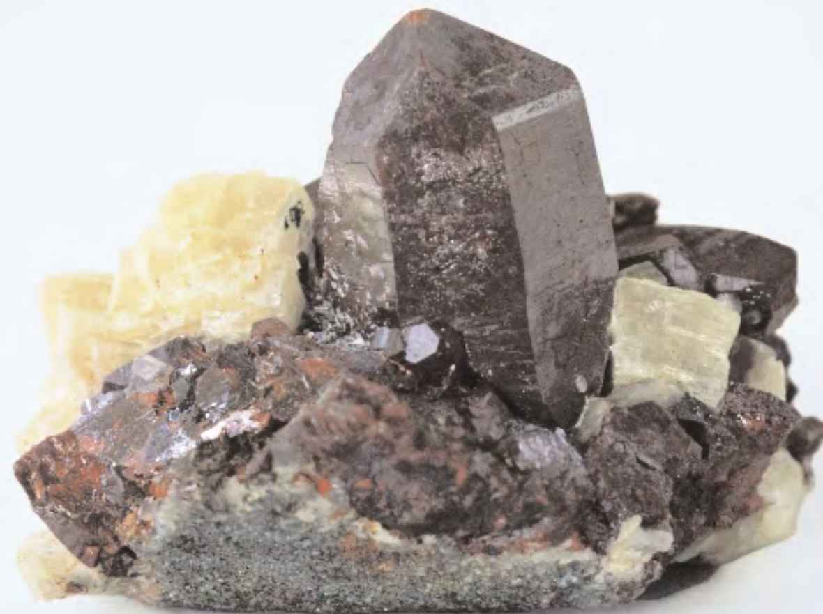
Zinnober. Das Mineral wird pulverisiert zu Tabletten verarbeitet, die bei akuten und chronischen Katarrhen der Atemwege eingesetzt werden.

Welche Mittel der Arzt wählt, ob als Gesamtextrakt oder in einer homöopathischen Potenz, richtet sich nach der Art und dem Verlauf der Erkrankung, den Symptomen, den Beschwerden, der Krankheitsdauer,